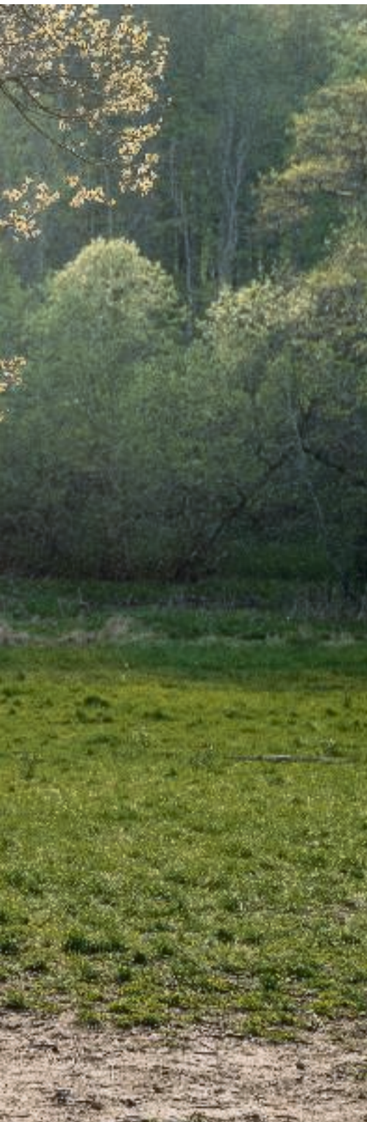
Forældre skal blive bedre til ikke at begrænse deres børn i den vilde og risikofyldte leg, selv om de er bange for, at børnene slår sig, lyder det fra to legeforskere.

Forældre skal lade være med at stå under træet eller ved siden af trampolinen og råbe »pas på«. I stedet kan de sige det en enkelt gang, og derefter gå om i forhaven og lade børnene lege alene i baghaven.